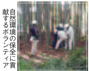
自然環境の保全に貢献するボランティア